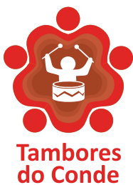
Tambores do Conde

A alegria e a musicalidade diferenciada são características que o Tambores leva aonde vai. Todos os espetáculos são especiais para os jovens, mas a agenda de 2015 teve um momento particularmente emocionante, quando eles tocaram em casa durante o Albras Mais Perto de Você de Vila do Conde no mês de julho. O projeto de Albras valoriza a cultura local e a participação do Tambores representa o reconhecimento ao talento dos integrantes do