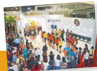
MAIO XII Feira da Indústria do Pará (Hangar)