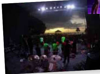
JUNHO Fête de la Musique (Estação das Docas)