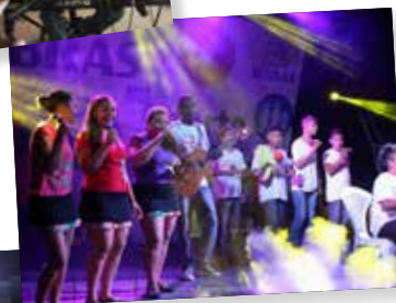
JULHO Albras Mais Perto de Você de Vila do Conde