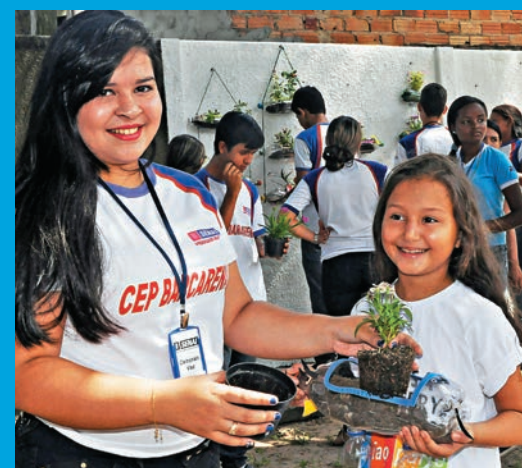
Alunos da turma de “Artesanato com Sucata” desenvolveram vasos para plantas feitos com material reciclável

Casa Imerys – unidade Bairro Industrial: Passagem das flores, número 06.